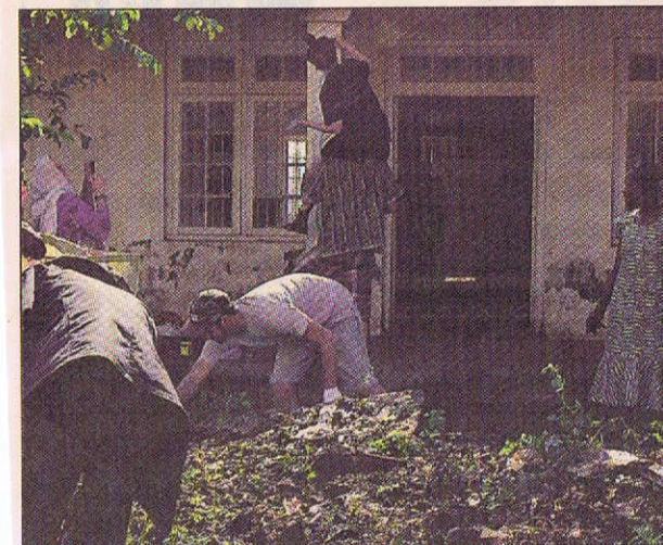
Kenyanska och svenska ungdomar hjälptes åt att röja utanför det tänkta ungdomshuset i Kimilili.